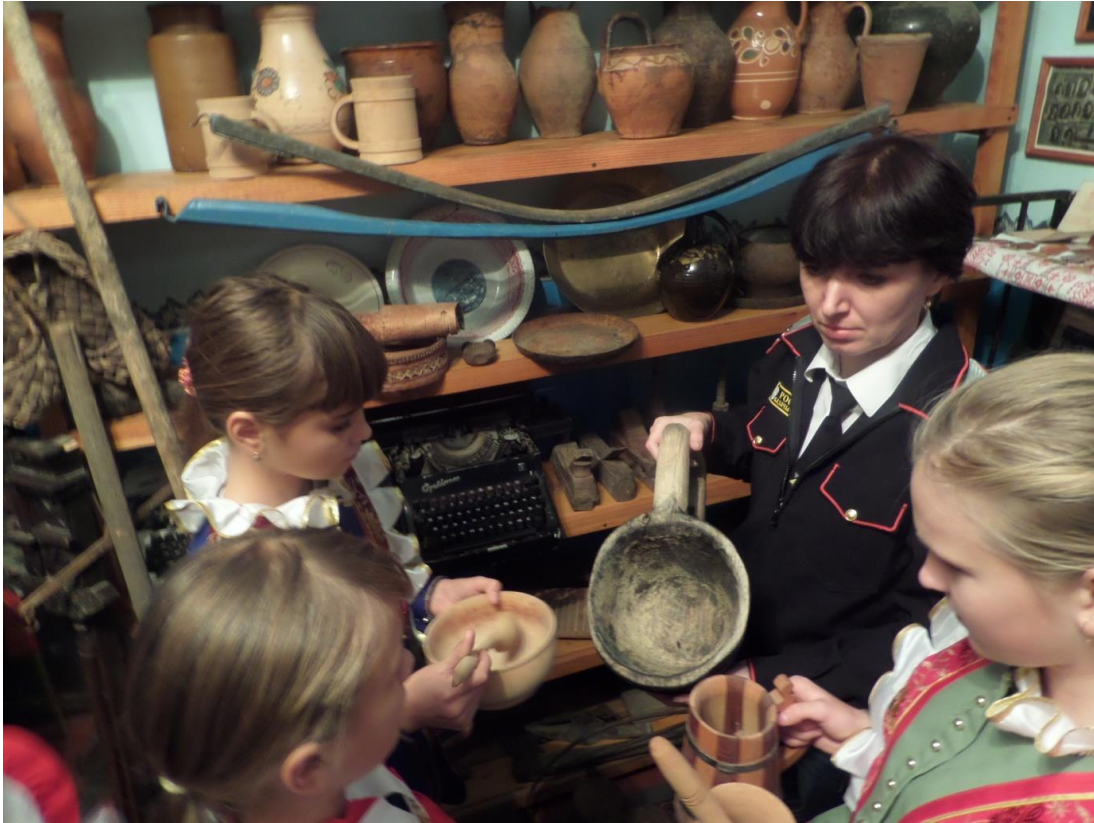
Использование предметов домашней утвари