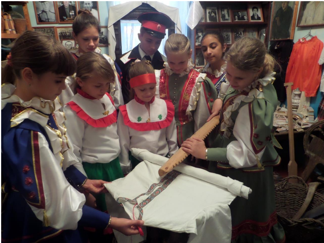
Практическое занятие по использованию рубеля