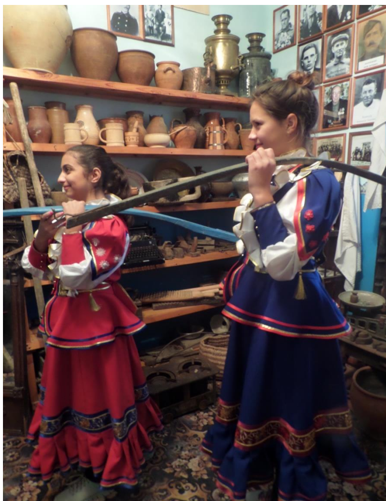
Практическое занятие по использованию коромысла